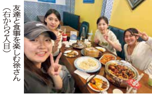
友達と食事を楽しむ皆さん(右から目)