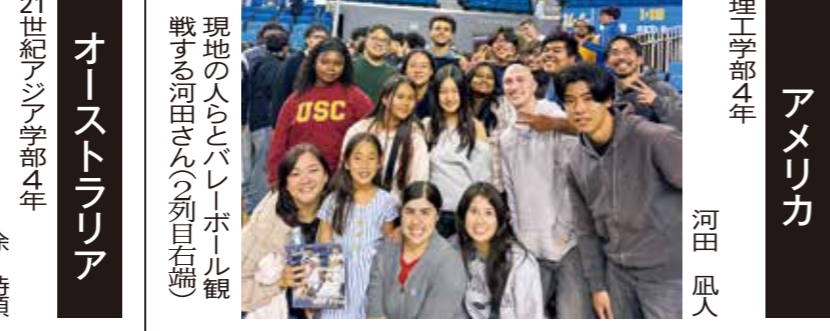
寒稽古の皆勤表彰状を手に記念撮影する各クラブの代表者ら