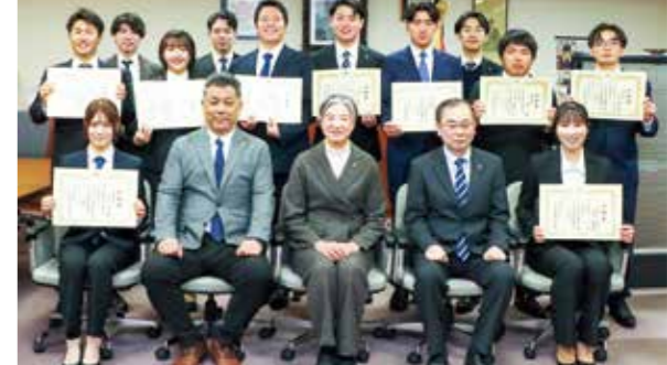
寒稽古の皆勤表彰状を手に記念撮影する各クラブの代表者ら

寒稽古皆勤 53人表彰 本学は、国士館伝統行事の寒稽古(かんげいこ)に、皆勤(けいじん)で参加した学生を表彰し、今後のさらなる活躍を期することを述べ、皆勤の学生らにたたき。 令和7年度の寒稽古は1月6日から9日の4日間にわたり実施され、世田谷、町田、多摩の各キャンパスで活動する武道系を中心としたクラブの学生・教職員延べ3901人が参加した。