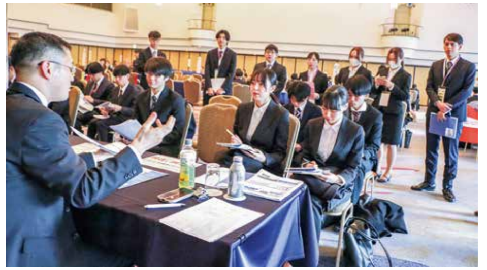
企業説明を熱心に聞く3年生。後方では1・2年生も見学した