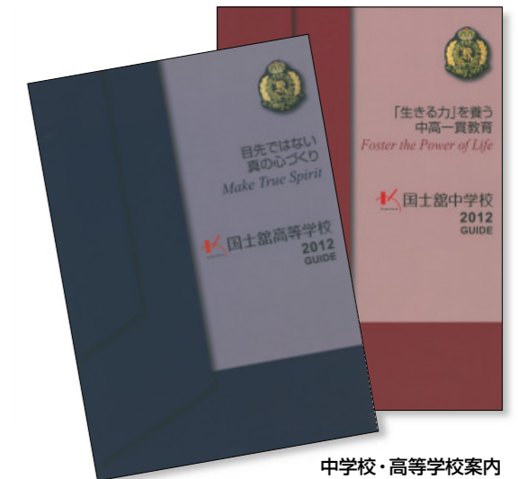
中学校・高等学校案内 国史館中学校・高等学校の総合案内 年1回発行