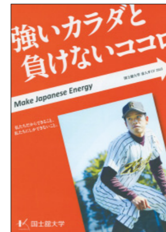
企業向けリーフレット 企業採用担当の方向け大学案内 年1回発行