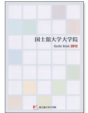
大学院案内 主に国史館大学大学院受験生向け案内 年1回発行