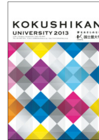
大学案内 主に国史館大学受験生向け案内 年1回発行