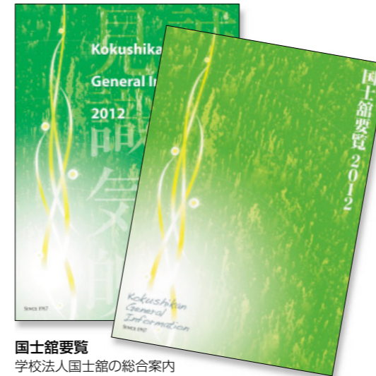
国史館要覧 学校法人国史館の総合案内 日本語版と英語版で年1回発行

本学の情報を学校案内や大学新聞など、さまざまな発行形態の出版物で情報提供しています。