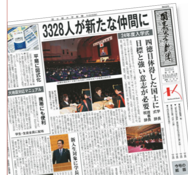
大学新聞 本学の現況を記事形式で掲載 ブランケット版で年4回発行