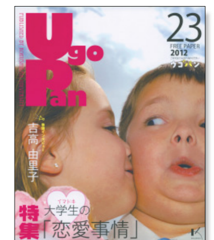
ウゴパン 国史館大学在学生向け情報誌 年5回発行