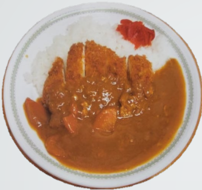
チキン カツカレー 430円