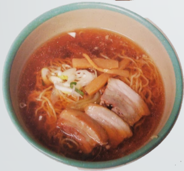
喜多方風ラーメン 350円