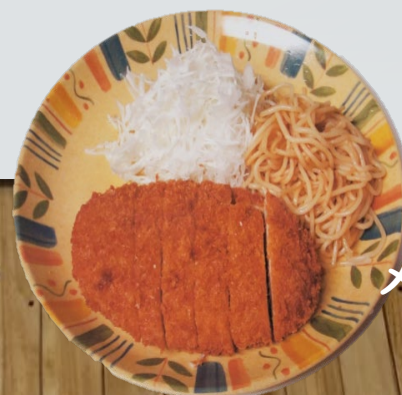
メンチカツ定食 380円