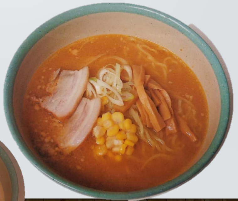
北海道味噌ラーメン 370円