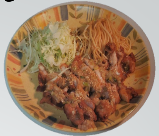
塩だれチキン定食 450円