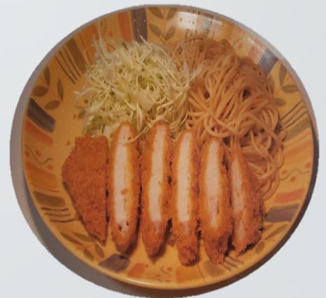
チキンカツ定食 380円