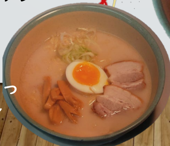
博多とんこつ ラーメン 370円