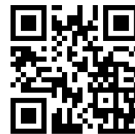
建築学系ホームページ