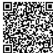
大学ホームページ