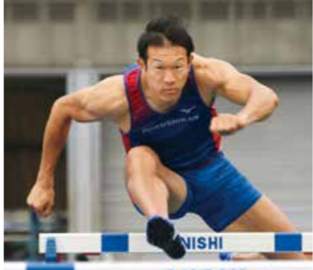
多摩キャンパス陸上競技場で練習に打ち込む(2019年)

■自粛期間中の過ごし方 自宅では高負荷の練習ができない代わりに、腕立て伏せや腹筋の自重トレーニング、ゴムチューブを使ってのトレーニングを中心に行っていました。自粛期間中は朝6時に起き夜10時には寝るという生活でした。トレーニングは一日3時間以内で、その他の時間は娘のお菓子作りや作業、料理などをしていました。