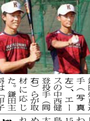
国士館高校の野球部員たち

国士館高校 日本高校野球連盟(高野連)は6月10日、中止となった第92回選抜高等学校野球大会(センバツ)に出場する国士館高校を正式に発表しました。