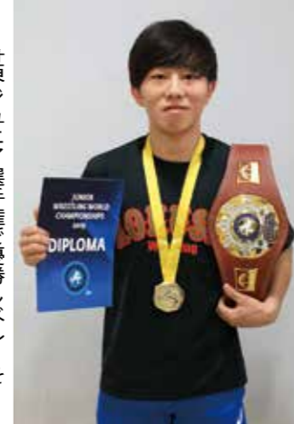
世界ジュニア選手権で優勝した阿部敏弥選手(2019年)

■趣味の動画でストレス発散 最初はそこまで重く受け止めていなかったのですが、感染者が増えたり、危険な状況が広がってきたり、近頃のニュースに行くと怖かったです。外に出られない状況だったので、部屋の中で映画を見たり、YouTubeなどで動画を見たりしていました。キャンプや野球の動画もよく見ました。