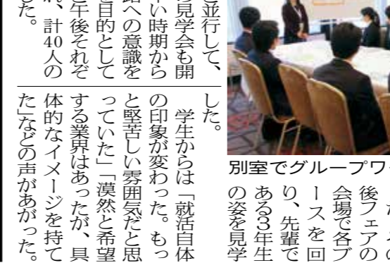
別室でグループワークを行う1・2年生

1・2年生の就活見学会も、卒業後の進路への意識を高めてもらうことを目的としており、午前と午後それぞれ実施され、計40人の学生が参加した。 就活見学会では、キャリア形成支援センターの職員から、就職活動の進め方や必要な書類の準備方法などについて説明を受けた。また、グループワークを通じて、企業研究や自己分析の重要性についても学んだ。