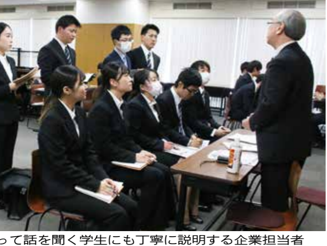
立って話を聞く学生にも丁寧に説明する企業担当者

学部の3年生と修士1年生を対象とした学内業界・企業セミナー「就活！HOT SPACE」が2月12日から4日間、世田谷キャンパス34号館2階の各教室で開催され、延べ約300人の学生が参加した。 会場には、優良中小企業を中心に200社が出展した。学生らは出展企業概要が掲載された教室入り口前の掲示板に集まり、職種や勤務地など