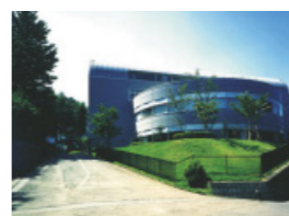
鶴川メイプルホール完成