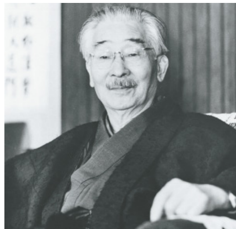
創立者 柴田徳次郎 1890~1973