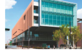
メイプルセンチュリーホール完成