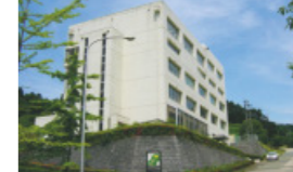
国士館大学福祉専門学校設置