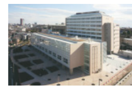
世田谷キャンパス梅ヶ丘校舎(34号館)完成