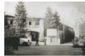
国士館短期大学設置