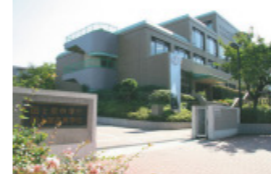
国士館高等学校・中学校校舎完成