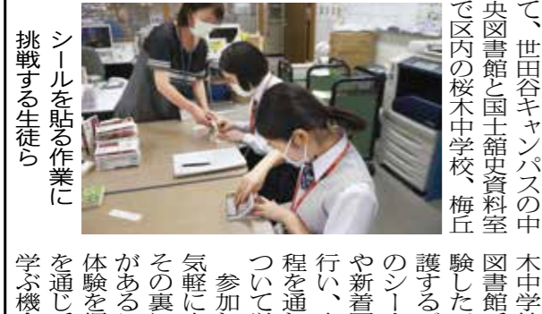
ヘッドライトをつけた学生が全身を使って床下の土砂を撤去する

本学は、9月24日の台風15号による浸水被害を受けた静岡県葵区に、10月15日から23日の土日を利用して4日間、学生ボランティア活動が許可された。