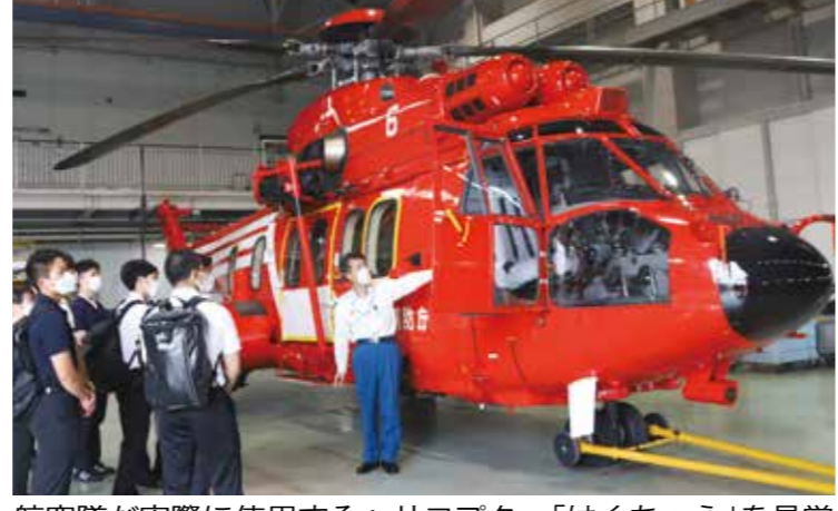
航空隊が実際に使用するヘリコプター「はくちょう」を見学

体育学部スポーツ医学科は、大規模災害に対応する特殊車両や特別な訓練施設を見学した。航空隊と救助部隊を見学した。