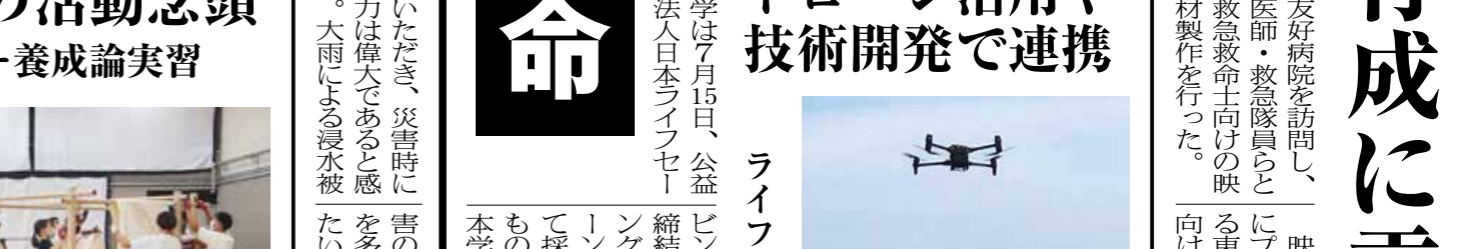
三浦海岸での訓練の様子

救急救命 本学は7月15日、公益財団法人日本ライフセーバー協会と包括協定を締結し、ライフセーバー協会が実施するドローン活用や技術開発で連携