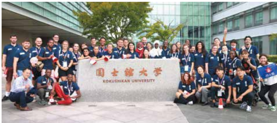
参加者全員で記念撮影（本学世田谷キャンパス）

ENGO Youthランスの5団体、40人が、欧州非政府スポーツ機構（ENGO Youthランス）の「実践的アイデア共有」を開催した。本研修会は、東京の2024年大会を控え、パリ2024大会を控え、フランス、2026年8月8日から14日まで東京・国立オリンピック記念総合競技場（有明）で、本学が主催する「SDGsスポーツ」に貢献できるかをテーマに、本学のほか、ハラス、セネガル、フランスの3カ国を代表する選手、職員ら約40人が参加した。 本研修会は、東京の2024年大会を控え、パリ2024大会を控え、フランス、2026年8月8日から14日まで東京・国立オリンピック記念総合競技場（有明）で、本学が主催する「SDGsスポーツ」に貢献できるかをテーマに、本学のほか、ハラス、セネガル、フランスの3カ国を代表する選手、職員ら約40人が参加した。