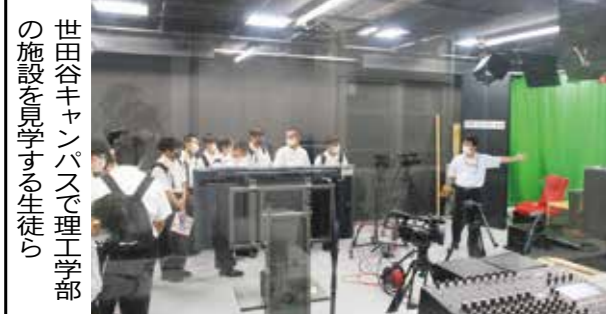
世田谷キャンパス理工学部 施設見学する生徒ら

世田谷キャンパス理工学部 施設見学する生徒ら 本学は、9月24日の台風15号による浸水被害を受けた静岡県葵区に、10月15日から23日の土日を利用して4日間、学生ボランティア活動が許可された。