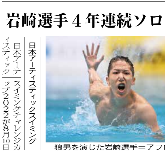
狼男を演じた岩崎選手

在学生の皆さん 日本学生支援機構奨学金の緊急・応急・家計急変・JASSO災害支援金の申請を受け付けます。