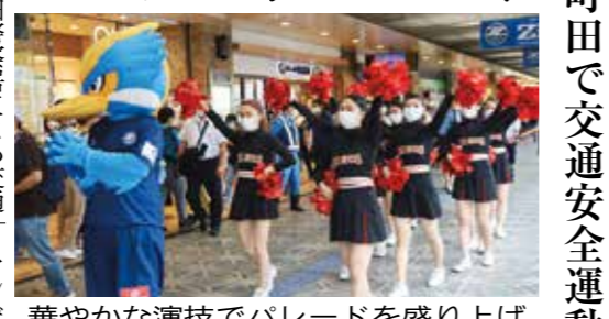
華やかな演技でパレードを盛り上げた本学チアダンス部「エルブズ」

町田で交通安全運動に協力 エルブズがパレード 町田警察署による交通安全キャンペーンが9月24日、東京・J町田駅前で開催され、本学ダンス部「エルブズ」がパレードに参加した。 本イベントは、警備員ら感謝状と記念品の監視庁マークシートキャラクター1・ヒーローくん人形が贈られた。