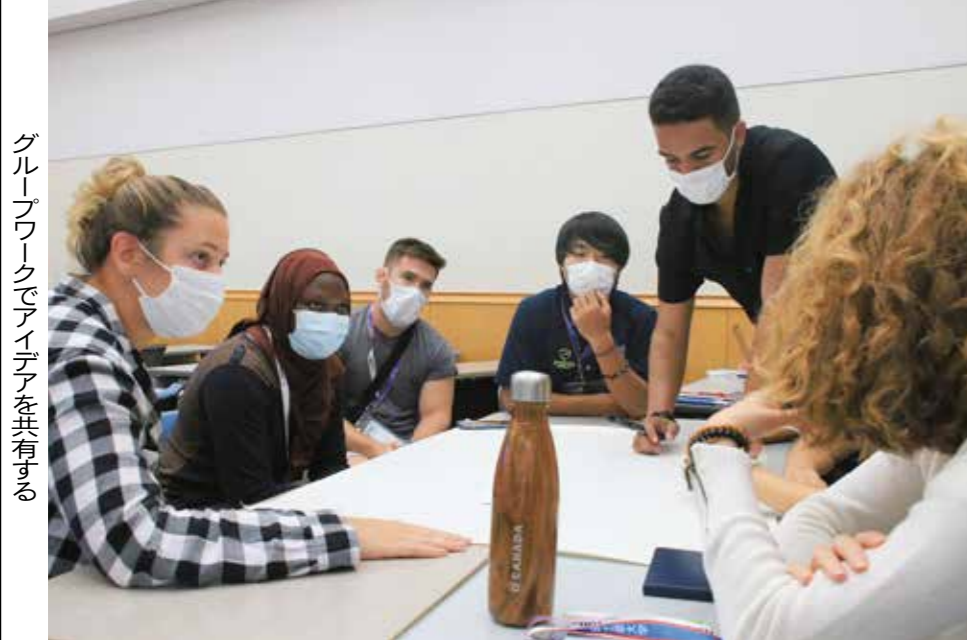
グループワークでアイデアを共有する