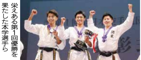
栄えある第1回優勝を果した本学選手ら

西が丘で行われ、本学が21年ぶりに優勝した。23年ぶりに3度目の優勝を果たした。