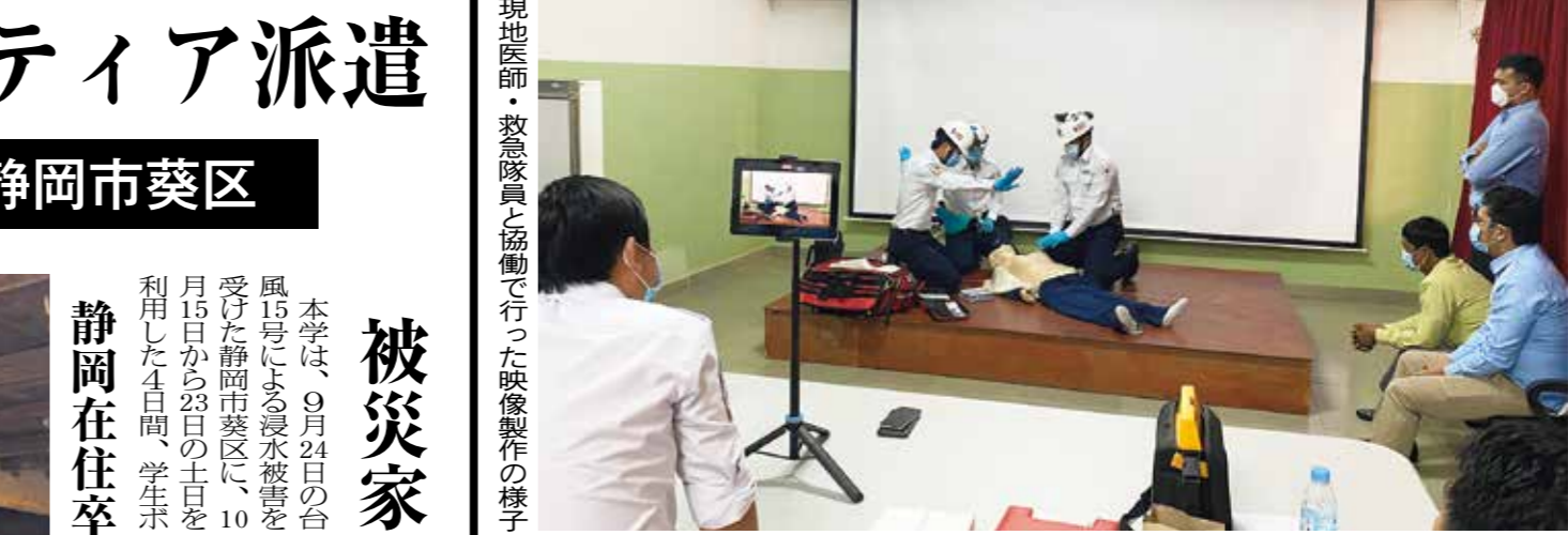
現地医師・救急隊員と協働で行った映像製作の様子

学芸員目指し博物館実習 展示準備をする実習生 国士館史料室では、7月29日から8月5日の7日間の日程で、博物館実習(館内実習)を実施した。