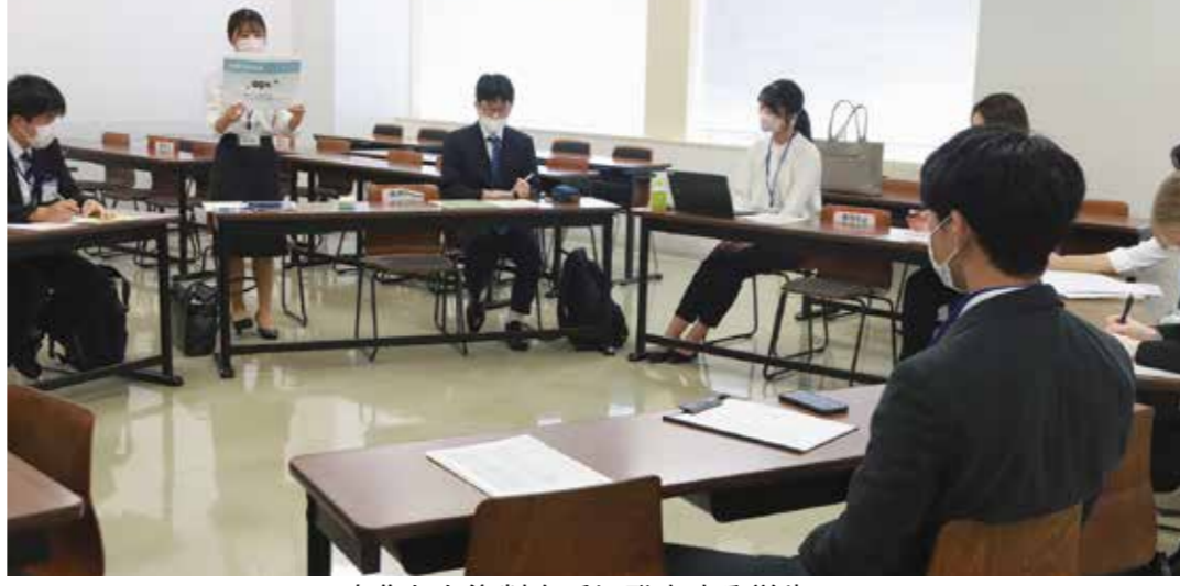
自作した資料を手に発表する学生

学生「働くことに興味わいた」 本学主催のインターンシップが3年ぶりに開催され、8月上旬から9月上旬にかけて学部3年生、大学院1年生の88人が受け入れ先の約40団体でさまざまな仕事を体験した。参加にあたっては、7月に正しい言葉遣いやビジネスマナー、インターンシップの心構えなどを