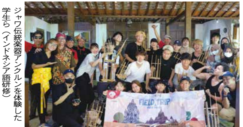
ジャワ伝統楽器「アンクルン」を体験した学生ら(インドネシア研修)