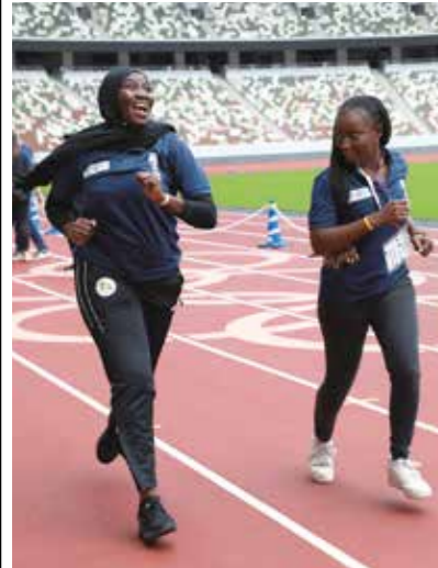
国立競技場のトラックを走る参加者

本プロジェクトには、競技者や指導者をはじめ、多くの人材が参加している。本学が「SDGsスポーツ」を通じて、国際的な交流の場を提供し、多様な国や文化を持つ人々と交流し、互いに学びあう機会を創出している。本学は、この機会を通じて、国際的な交流の場を提供し、多様な国や文化を持つ人々と交流し、互いに学びあう機会を創出している。