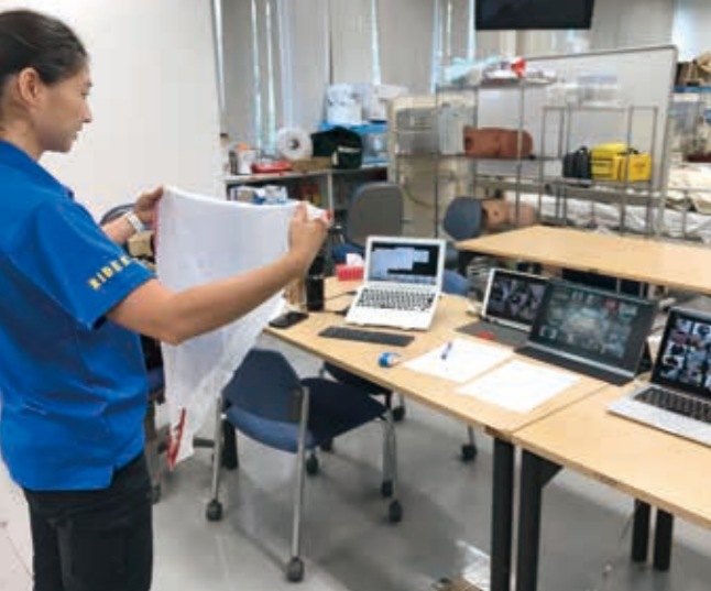
月ヶ瀬准教授のZoomによる授業風景

4月18日から5月11日にかけて、全学部の新入生を対象とした防災総合基礎教育が実施された。また、学修支援では、manabaの「質問」機能を活用し、教員が学生の質問にリアルタイムで応答できる。